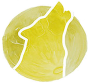
Janvyè Lalin lou

Fè an sòt ke ou byen abiye pou tan, e si ou kapab, pote flach ou pou ede'w navige chemen'w.