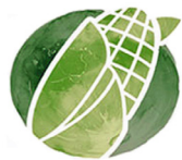
Septanm Lalin Mayi