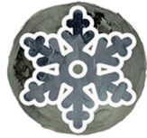
Fevriye Lalin Lanèj