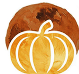
Oktòb Lalin Rekòlt