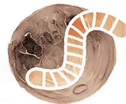
Mas Lalin Vètè