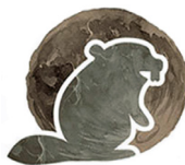
Novanm Lalin Kastò