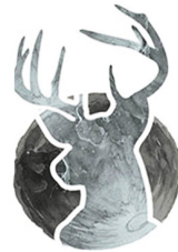
Jiyè Lalin Mal