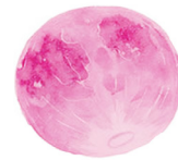
Avril Lalin Roz