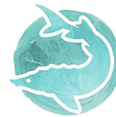
Out Lalin Estriyon