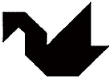
chim thiên nga

Hãy thử những hình ảnh này mà không có đường phân chia các bản. Có khó hơn không?